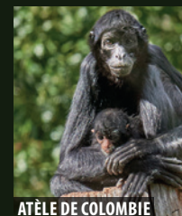
ATÈLE DE COLOMBIE